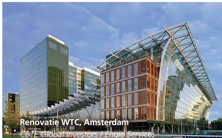
Renovatie WTC, Amsterdam CBTF Global Investors / Engie Services