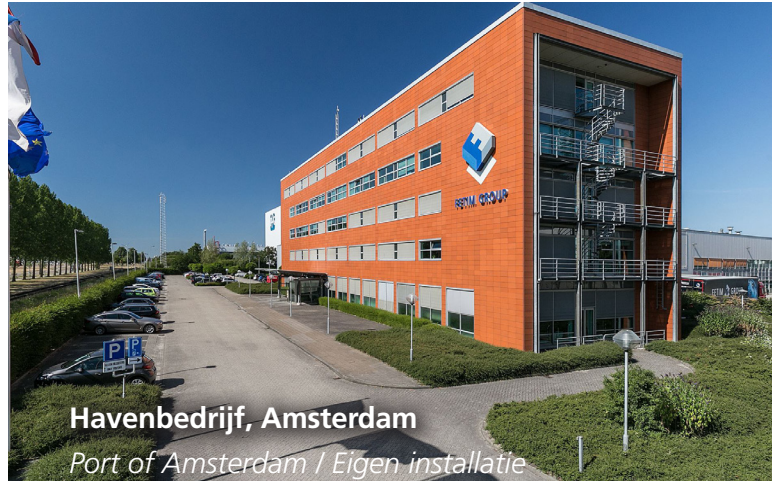
Havenbedrijf, Amsterdam Port of Amsterdam / Eigen installatie