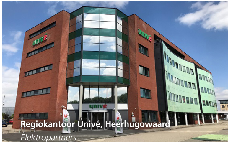
Regiokantoor Univé, Heerhugowaard Elektropartners