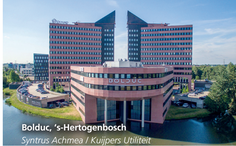
Bolduc, 's-Hertogenbosch Syntrus Achmea / Kuijpers Utiliteit

Wij evalueren het resultaat met u en geven zo nodig instructies aan beheerders en eindgebruikers. Onze ervaringen zetten we weer in bij nieuwe projecten.